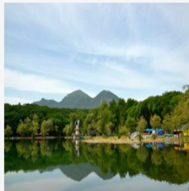
Железноводск (13 ОБЪЕКТОВ)